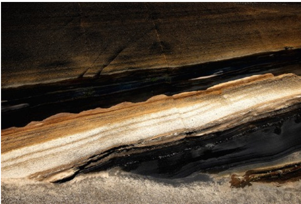
Elsa Lunghini (née en 1973) Photographe, elle va chercher la matière dans ses profondeurs, en capte la lumière et effleure l'abstraction avec aisance. En couleur ou en noir et blanc, tout est délicat, suggéré, perceptible et choisi. Effleurement - Maroc Photographie - 60 x 80 cm