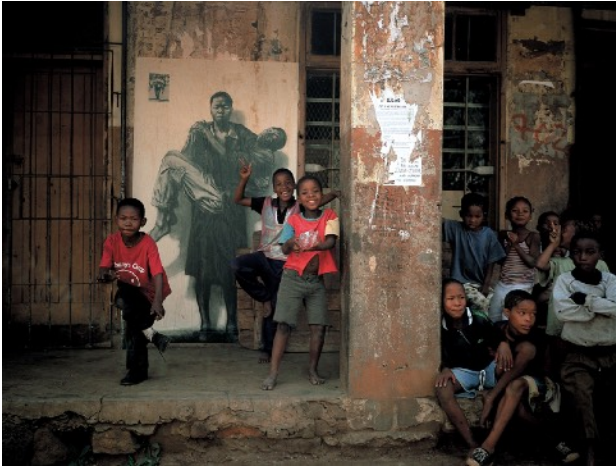
Ernest Pignon-Ernest (né en 1942) Une femme porte un homme dans les bras. Par un symbole biblique, cette image évoque les ravages du sida et certains faits historiques. Piéta Africaine - Afrique du Sud Soweto - Sérigraphie 2002